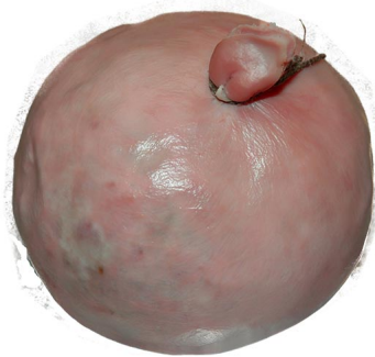
Pfälzer Saumagen klassisch - das Original